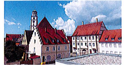
Von den oberen Etagen hat man einen wunderbaren Blick über die Dächer Lauingens.