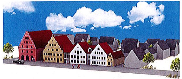
So sollen die Geschäftsgebäude zur Herzog-Georg-Straße verwirklicht werden.

Die Wohnungen zwischen 65 und 83 Quadratmetern, liegen im südlichen, ruhig gelegenen Teil des Grundstücks und verfügen alle über einen großen Sonnenbalkon oder eine Terrasse mit Gartenanteil. In einem modernen Haus ent-